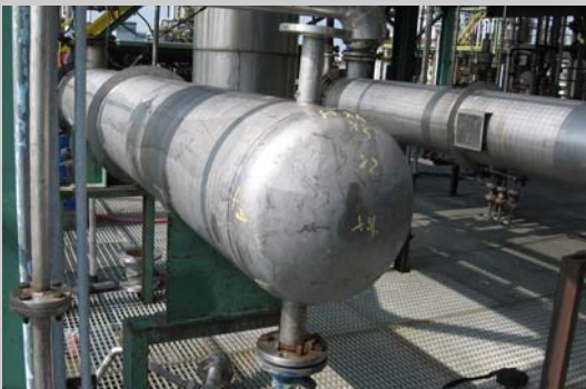
Verifica decennale su apparecchiatura PED.

Col tempo, acquistando attrezzature ed istruendo ed assumendo personale altamente qualificato, si afferma sempre più nel settore dei collaudi: nei controlli non distruttivi, operando su tutto il territorio nazionale, ottiene riconoscimenti e commesse con società di primo piano quali Enel-FFSS-Sham-Agip ecc.; nelle prove di laboratorio opera e collabora con enti quali Lloyd's Register, Bureau Veritas, Rina, Istituto Italiano della Saldatura, Tuv, Ispesl etc.